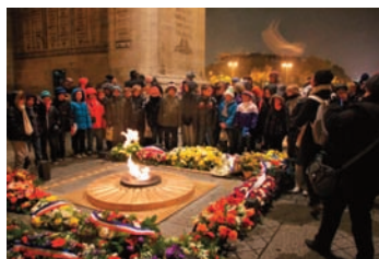
Soldat Inconnu sous l'Arc de Triomphe.