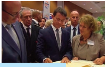
Avec le Premier ministre