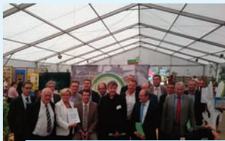
Lancement de la "Ferme 112"

du numérique, une conférence de presse traitant des agroressources au stand de la Chambre d'Agriculture, ou encore une conférence sur le dépistage du risque de mort subite chez le nouveau-né. Il a aussi