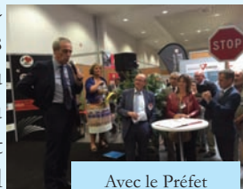
Avec le Préfet

Petites Entreprises du Bâtiment de la Marne ou encore assisté à un débat organisé par le conseil régional champardenais sur les solutions pouvant favoriser l'intégration