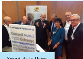
Stand de la Poste

rencontré les avocats qui tenaient des consultations gratuites pour les visiteurs, remis le prix " jeune espoir de la presse " pour la région, déjeuné avec la