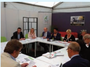
Rencontre avec les agriculteurs

Yves Détraigne a répondu présent à l'invitation de la FDSEA 51, début août, pour partager le " barbecue de la détresse " dans une exploitation agricole à Verrières, et évoquer les problématiques agricoles. Si les agriculteurs regrettent que le rôle économique, environnemental et social de l'agriculture soit aujourd'hui remis en cause par des prix inférieurs aux coûts de production et une inflation des normes et réglementations, le sénateur a pour sa part souligné que les mesures conjoncturelles ne pouvaient que régler temporairement la crise mais qu'il fallait aller plus loin dans les réformes afin, qu'à terme, les coûts français de production agricole puissent rivaliser avec ceux des pays voisins.